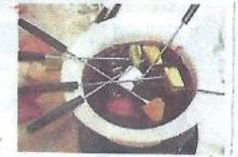
Brissolée de châtaignes